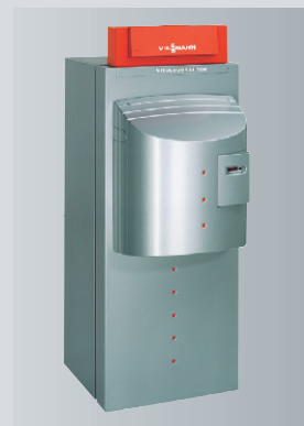
Vitocrossal 300 мощностью от 27 до 142 кВт