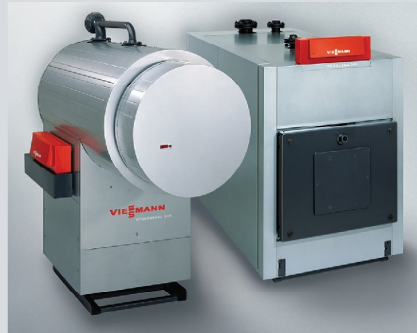
Vitocrossal 300 – газовый конденсационный котел мощностью от 187 до 978 кВт