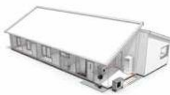
Воздушные/водяные тепловые насосы