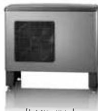
Воздушные/ водяные тепловые насосы