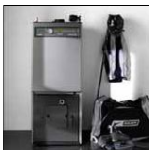
Котлы для домов и горелки для пеллетса