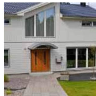
Комфорт - вода