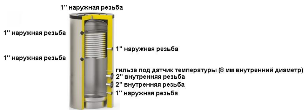
Схема бака серии AT Electro MONO