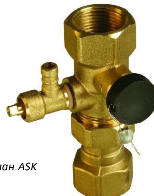
Рис. 1: Клапан ASK

Отсечной клапан позволяет отсечь расширительный бак от системы на время ее проверки или технического обслуживания. Вода из расширительного бака может быть выпущена через сливной клапан. Отсечной клапан имеет пластиковую крышку, которая может быть закрыта после технического обслуживания. Отсечной клапан снабжен пластиковой крышкой, позволяющей запломбировать его после проведения обслуживания.